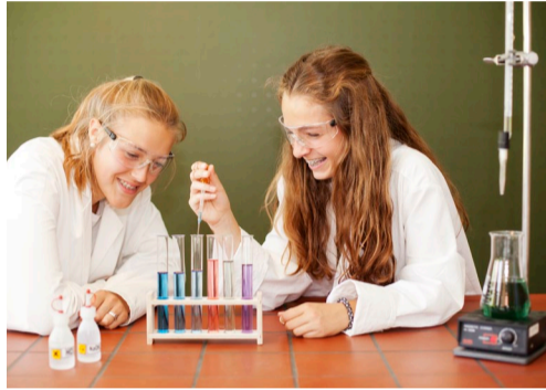
Das Hauptfach NWT bietet beste Möglichkeiten zum Lernen, Forschen und Experimentieren

Das Gymnasium Plochingen führt von Klasse 8 bis Klasse 10 zwei verschiedene Profile, das mathematisch-naturwissenschaftliche Profil mit dem Hauptfach Naturwissenschaft und Technik (NWT) und das sprachliche Profil mit der dritten Fremdsprache Spanisch.