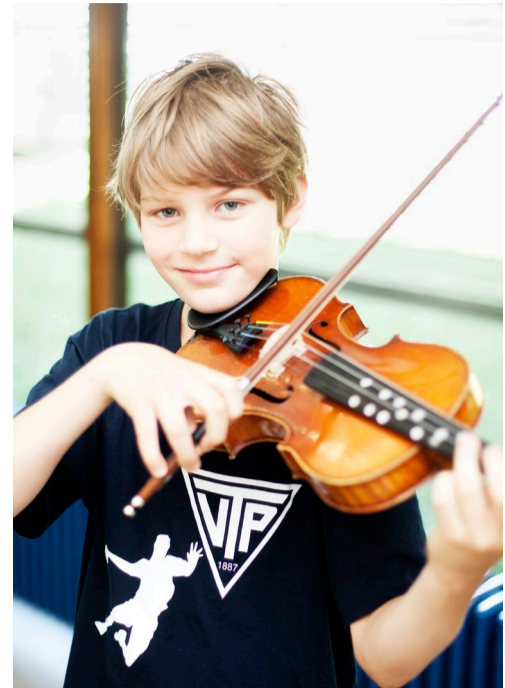
Die Streicherklassen leisten eine besondere musikalische Förderung und verbinden Schule mit Hobby

Am Gymnasium Plochingen ist die erste Fremdsprache ab Klasse 5 Englisch. Französisch oder Latein kommt im G8-Zug in Klasse 6 dazu, im G9-Zug ein Jahr später. Ab Klasse 8 wählen die Schülerinnen und Schüler Spanisch oder NWT als weiteres Hauptfach.