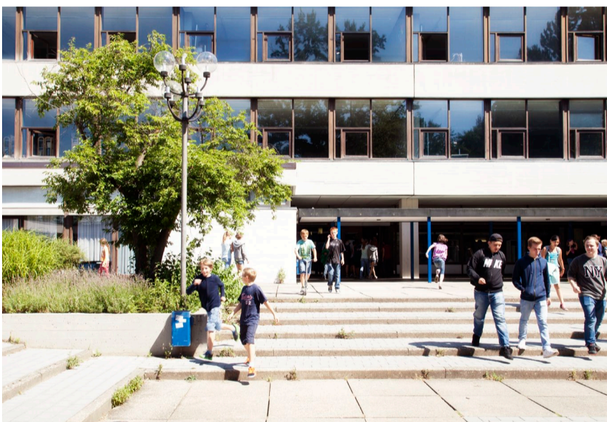
Mit den typischen Elementen der Architektur der 1960er Jahre, Sichtbeton und Glas, schafft der Architekt Jörg Könekamp ein eindrucksvolles Gebäude für das Gymnasium Plochingen