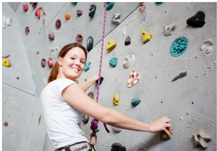
Die Kletterwand wird 2002 eingeweiht und seitdem ständig weiter ausgebaut