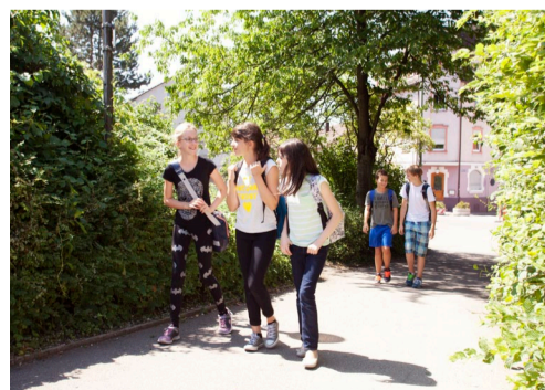
Viele Schülerinnen und Schüler kommen zu Fuß oder mit dem Rad zur Schule – können aber auch auf ein verlässliches Nahverkehrssystem vertrauen

Weitere Informationen finden Sie auf unserer Website: www.gymnasium-plochingen.de